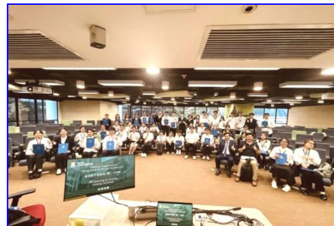
颁发证书 结业合影